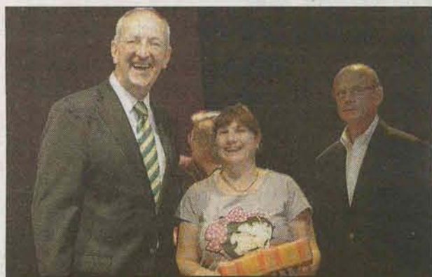
SURPRISE. Quarante-sept mamans de la commune ont reçu un cadeau.